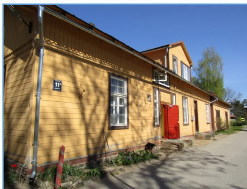
Skats uz dzīvojamo māju