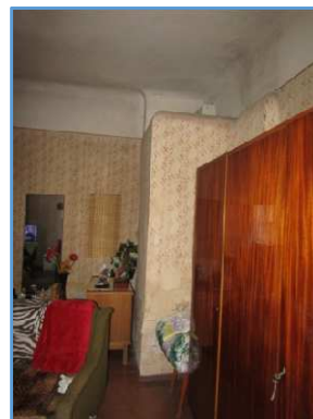
Skats uz istabu