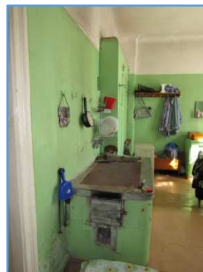
Skats uz virtuvi